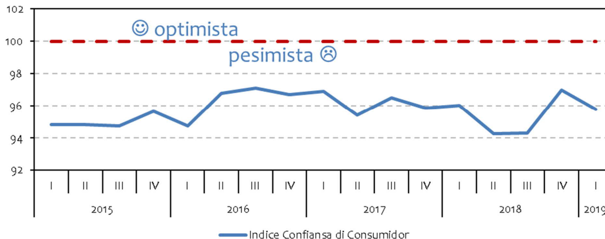
Grafiek 1: Indice Confiansa di Consumidor

E sentimento di consumidor a deteriora den e prome trimester di 2019, segun e ultimo resultado nan di e Encuesta di Confiansa di Consumidor (CCS) 2 di Banco Central di Aruba. E Indice di Confiansa di Consumidor a cai te na 95,8, for di 97,0 e trimester anterior, indicando sentimentonan relativamente pesimistico (Grafiek 1) 3 .